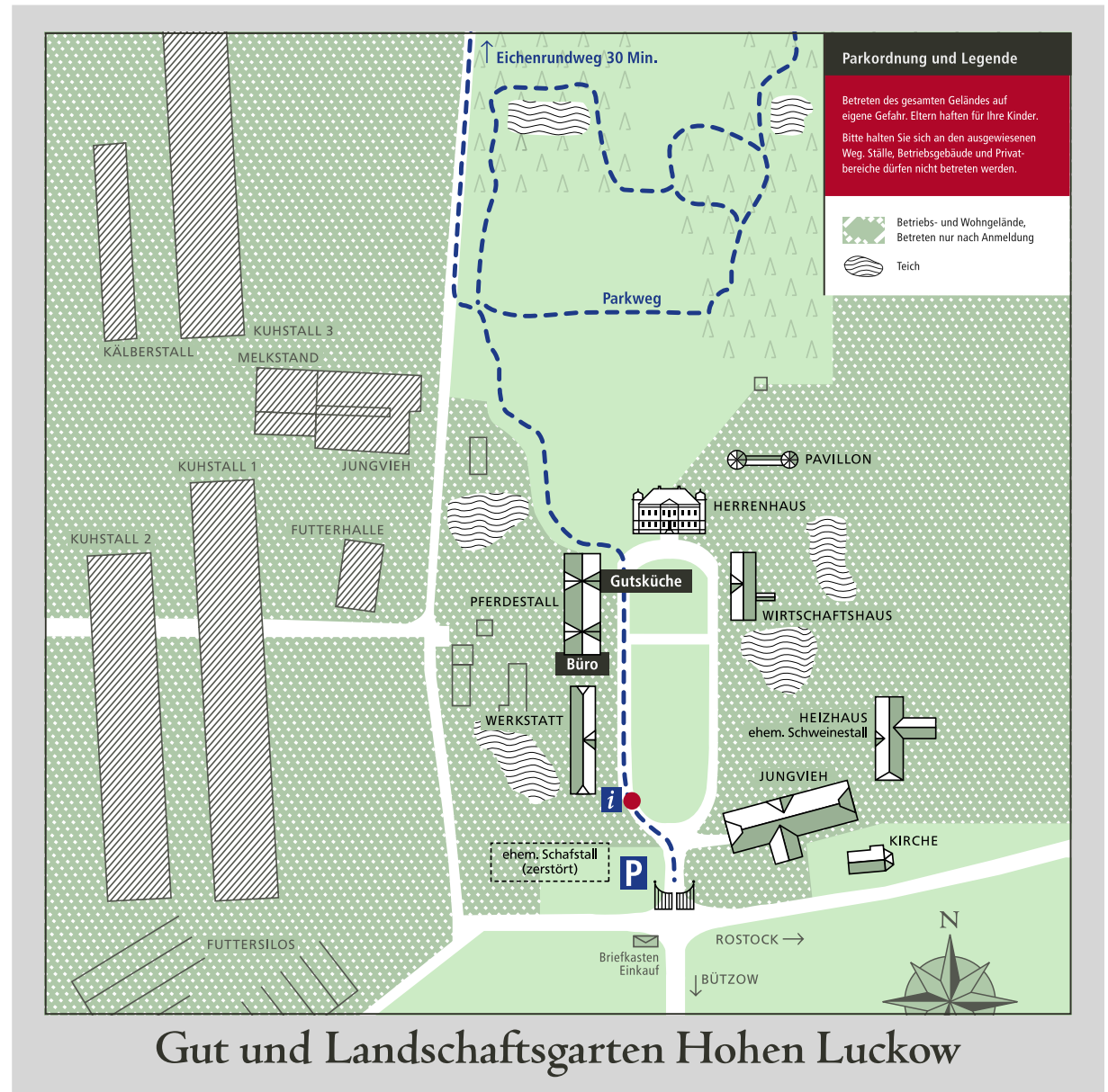
Wegleitsystem und Objektbeschilderung, links: Schildermodule, Folie auf Zinkblech, Breite 70 bzw. 40 cm, rechts: Lageplan des Betriebs mit Wegführung (Blau = öffentlich), Druck auf Hartschaumplatte, 100 × 100 cm