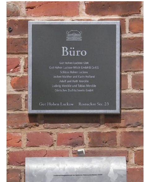
Anwendungsbeispiele des Wegleitsystems in Hohen Luckow, Trägermaterial (Eisen verzinkt) aus der Hofschlosserei, Schrift ausgestanzt (Metall durchscheinend), 3 Farben – 3 Wahrnehmungsstufen: Rot = Zugang verboten, Blau = Zugang erwünscht, Anthrazit = Zugang möglich und allgemeine Informationen